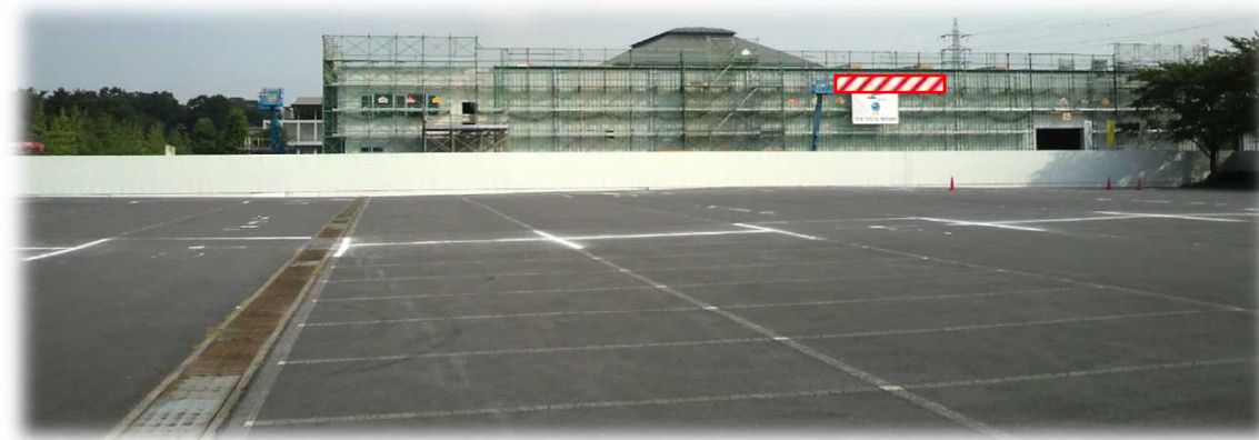
南側：水上公園駐車場